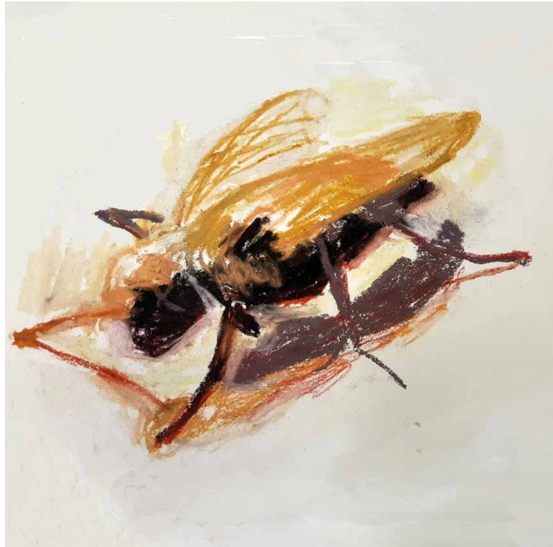
Ängel, 20x20 cm, olja på duk