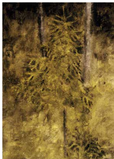
Gran 3, 85x100 cm, olja på duk