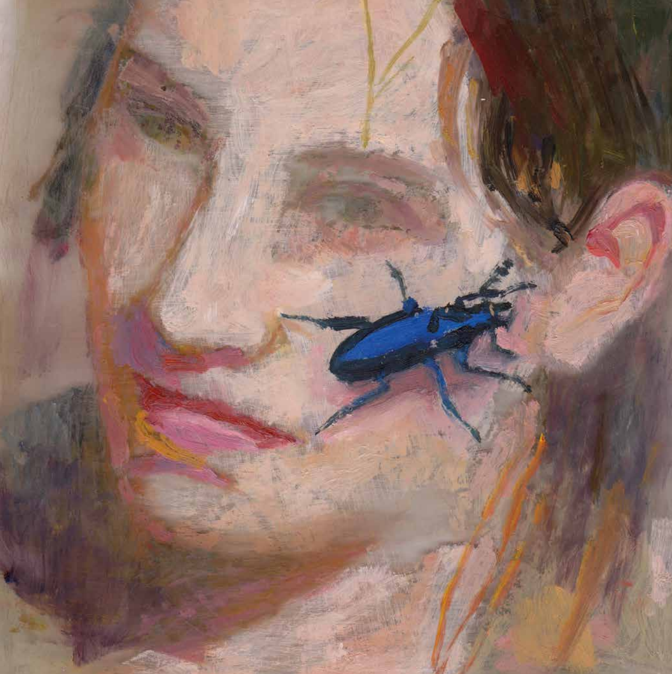
E som i ekoxe, 20x20 cm, olja på plexi

inte som forskningsobjekt, eller något som uppfyller en rad egenskaper, eller som en estetisk form. Trädet ”finns där i sin verklighet som min motpart och har att göra med mig liksom jag med det – bara på ett annat sätt. Man skall inte försöka försvaga relationens innebörd; relation är ömsesidighet”, skriver Buber. I mötet med trädet, eller när jag ser in i ögonen på ett djur, möter jag tillvarons väsen i all sin outgrundlighet. Skillnaden och likheten mellan jag och Du.