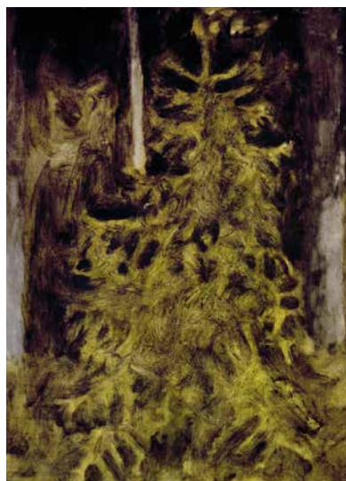
Gran 2, 85x58 cm, olja på duk